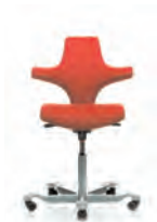
HÅG Capisco 8126