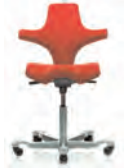
HÅG Capisco 8107