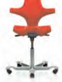
HÅG Capisco 8106