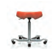
HÅG Capisco 8105